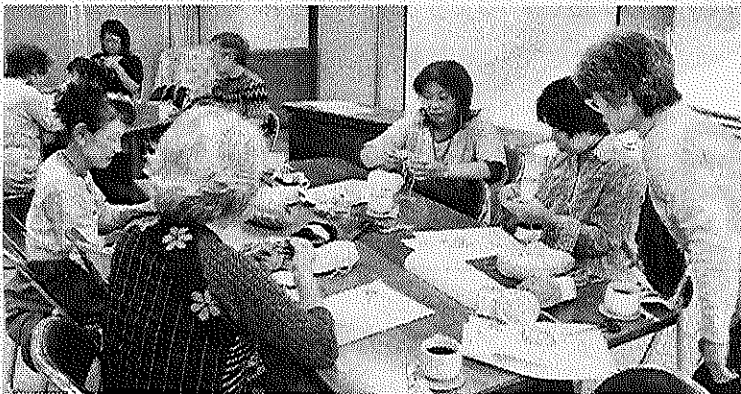
▲第1回 エコたわしをつくりました。