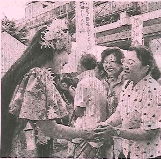
◎「がんばっぺ フラガール！」製作委員会 (ジェイ・シネカノン、Yahoo! JAPAN 他)

* 個人情報適切に管理し、今後の講座のお知らせなどに使用させていただきます。目的以外には使用いたしません。