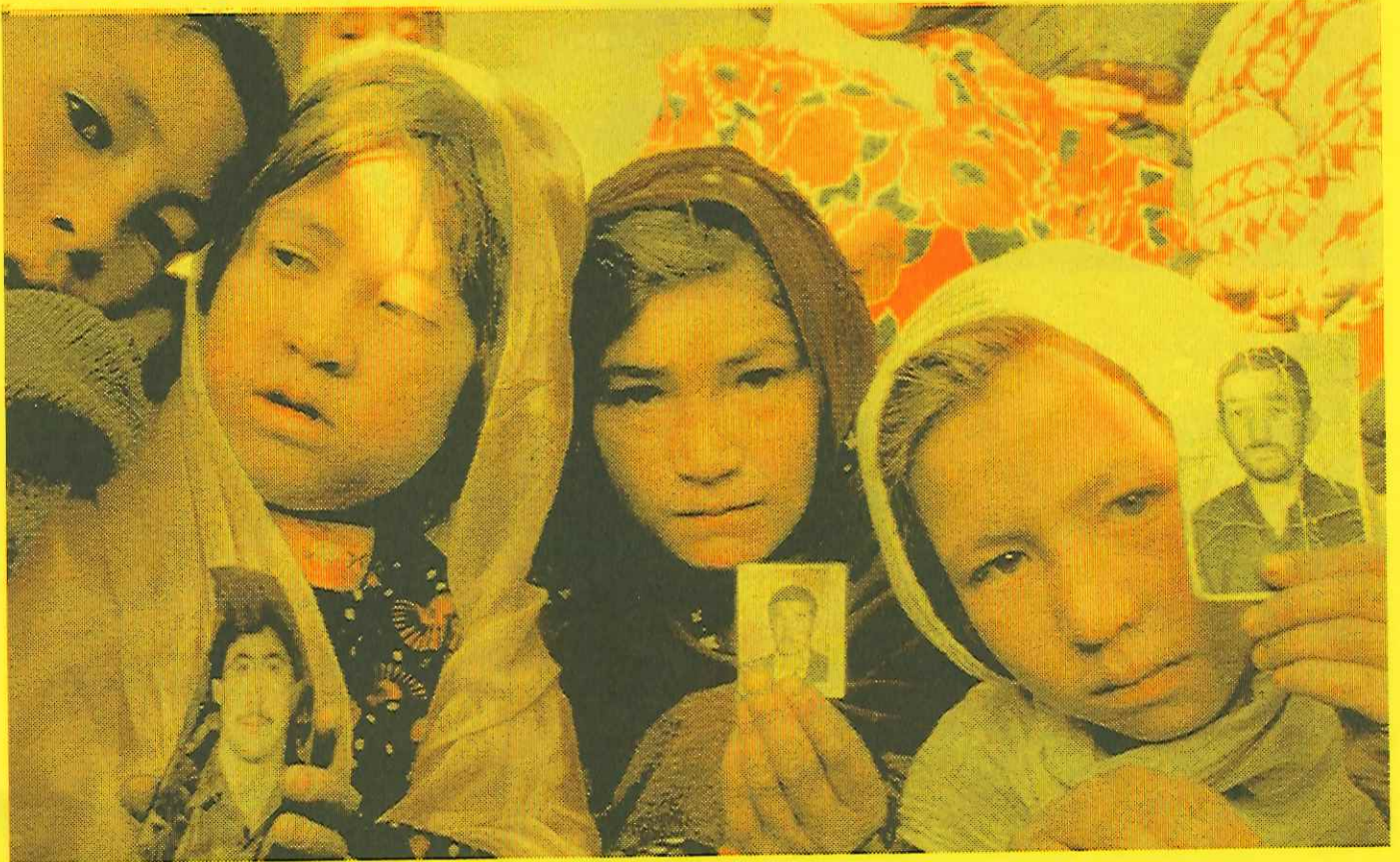
タリバンに父親を殺された少女たち（バーミヤン州ヤカオラン）