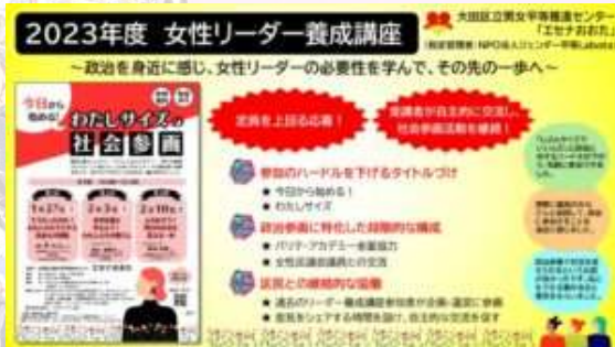
2位に輝いた「イチオシ事業」のスライド