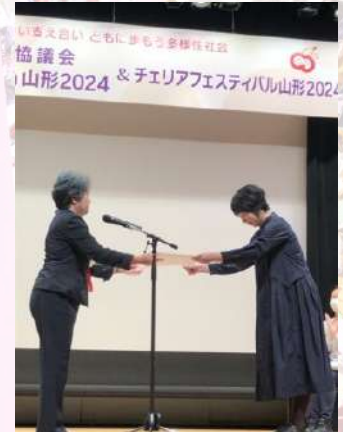
表彰式での中山副センター長