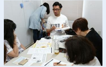
収録前の打ち合わせ