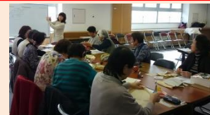
パッチワークを福島から避難している講師とその日に都内から集まった福島の方々で行ないました。

3年目となるこの事業を男女共同参画おおたが中心となった「被災者支援おおたネット実行委員会」で受託。エセナおおたに集まりながら被災者同士の交流が図られていました。お話をうかがうとそれぞれの悩みはより深刻化しており、このような事業はまだ続けたいところです。