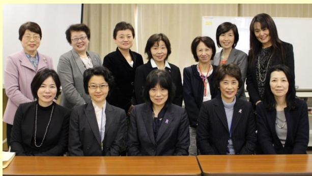
前列が内閣府のみなさま(局長は右から2番目)、後列が男女共同参画おおたの理事です。