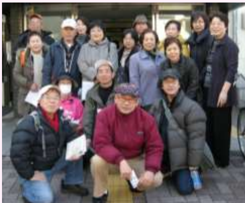
「大人の遠足」馬込界隈を散策 よく歩いた。 結構ハードだったとか。