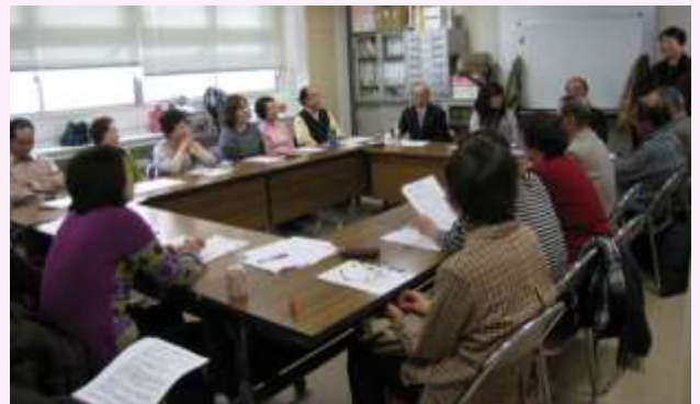
昼間のボランティア・スタッフ会議。